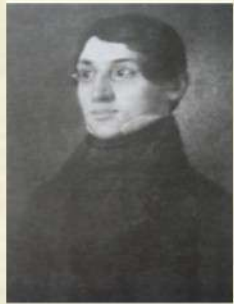
Наиздивин Н.И. С. 47