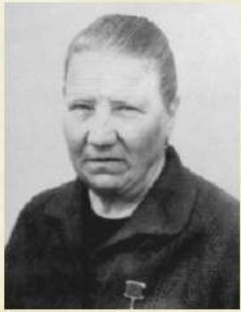
Капкива Е.И. С. 44