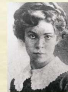
Загорская- Паустовская Е.С. С. 43

2024 ГОД – ГОД СЕМЬИ и 95-летия со дня образования Московской области и Луховицкого района